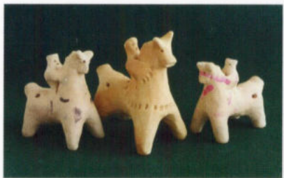
Игрушки из плешковской глины