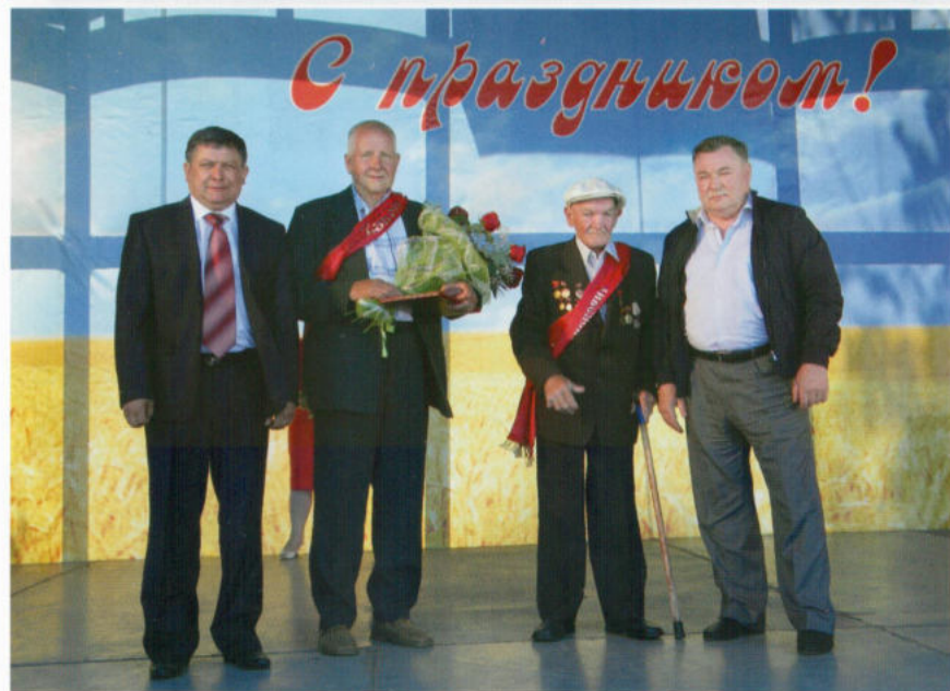
Губернатор А.П. Козлов на праздновании Дня Ливенского района