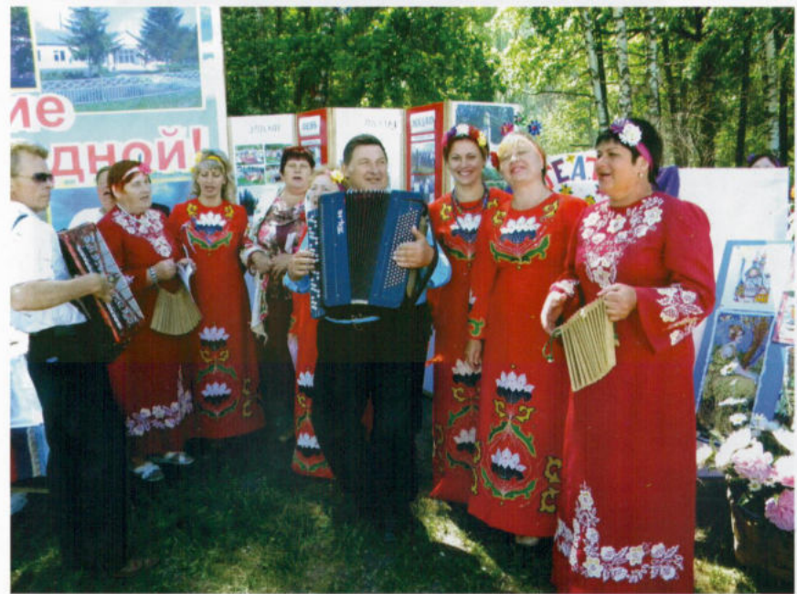
Празднование Дня Ливенского района