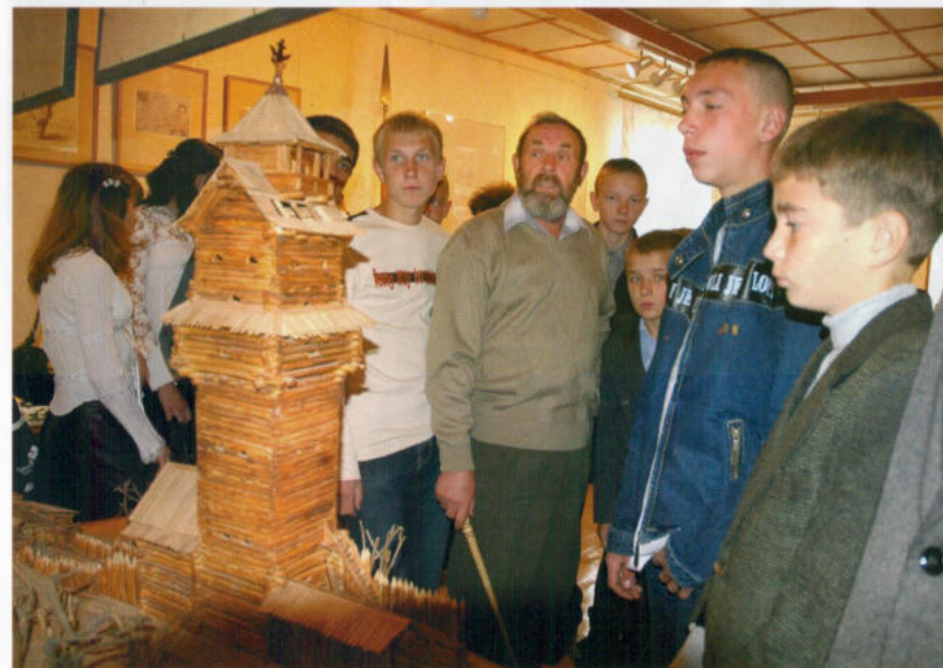
Экскурсия в краеведческом музее