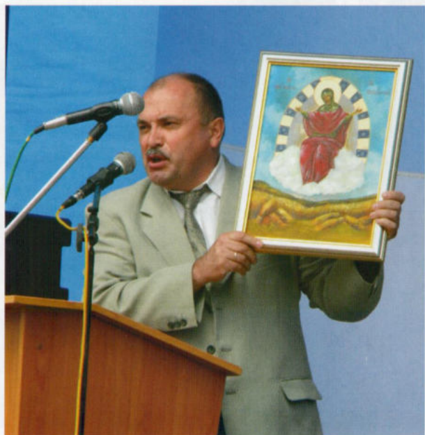
Глава города с 2007 г. по 2012 г. В.П.Ашихмин