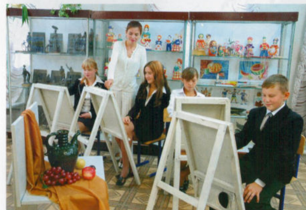
Урок живописи в детской художественной школе