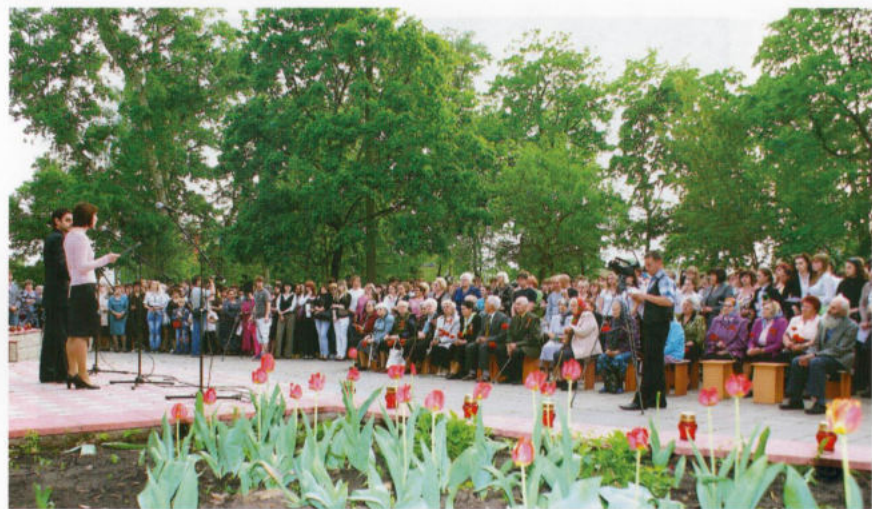
Героико-патриотическая акция молодёжи и ветеранов ВОВ «Свеча памяти»