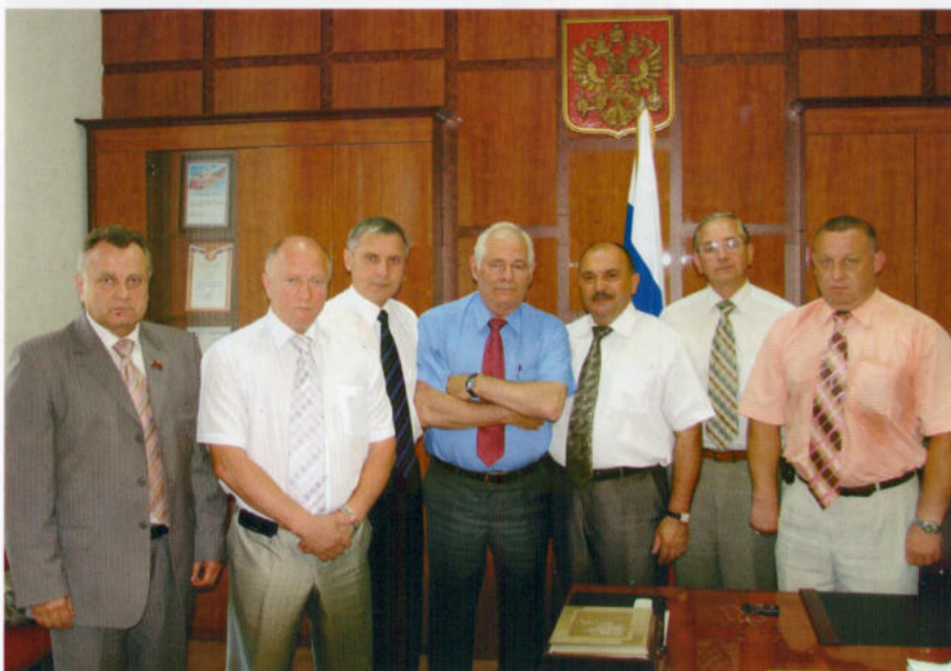
Ливенцы принимают Почётного гражданина г. Ливны Л.М. Рошаля