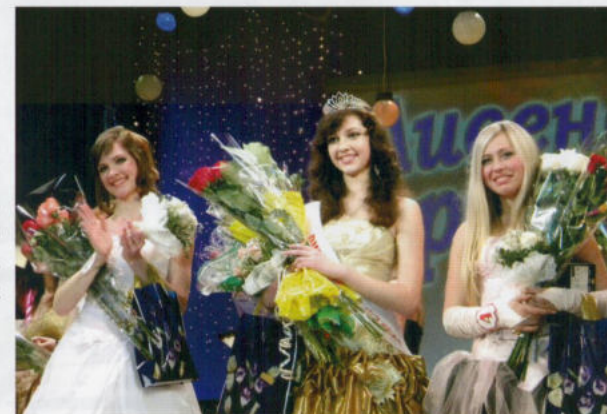
Победительницы городского конкурса «Ливенская красавица»