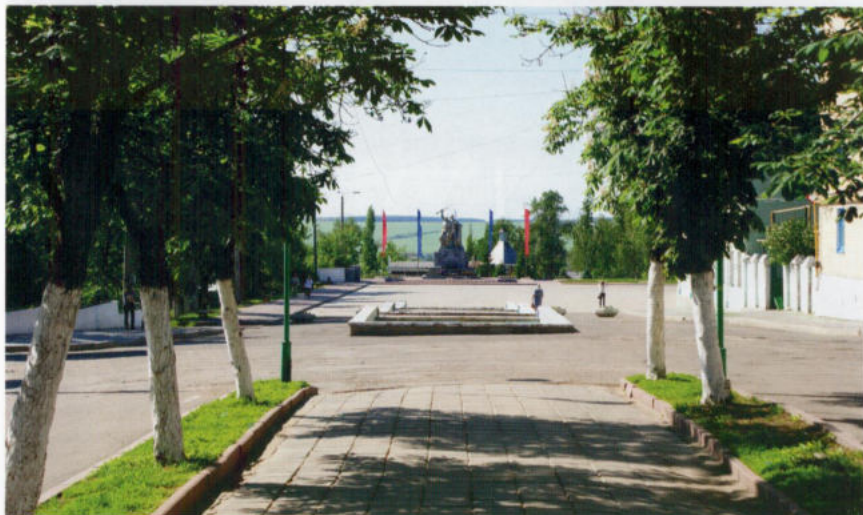
Вид на Площадь Победы с ул. Ленина