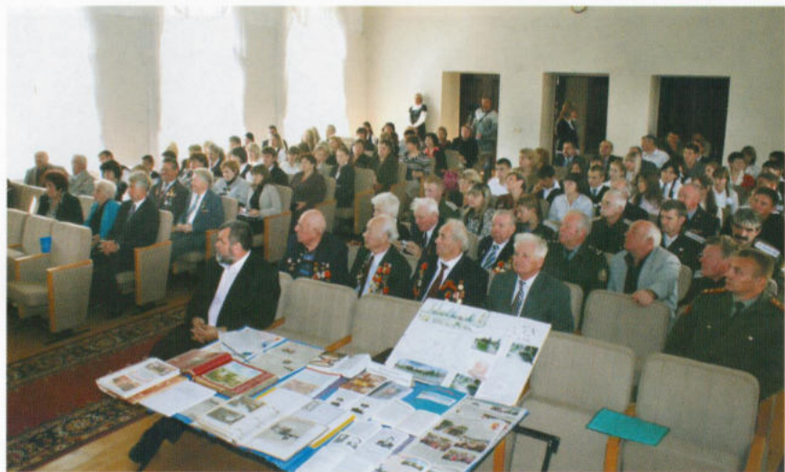
Научно-практическая конференция, посвящённая рассмотрению материалов на соискание звания «Город воинской славы»