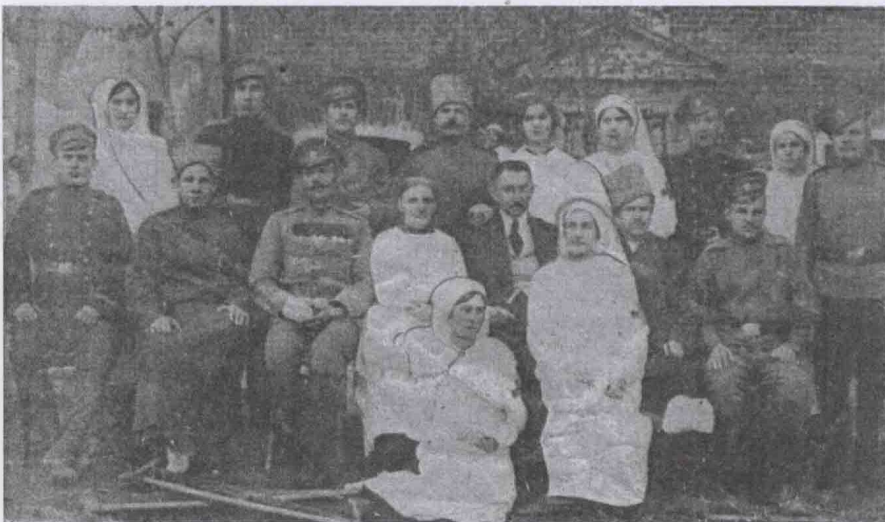
Лазарет земского союза в Ливнах

Ливенское уездное земство организовало 104 лечебных места на собственные средства, 310 – на средства земского союза и 88 мест – на частные средства. 21 августа, спустя полтора месяца после начала войны, в Ливны пришёл первый поезд с ранеными.