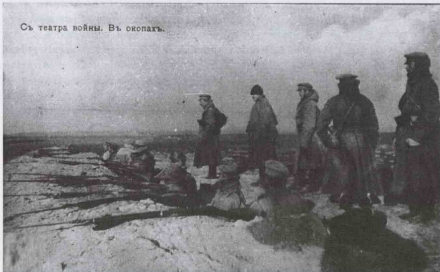
Съ театра войны. Въ окопахъ.