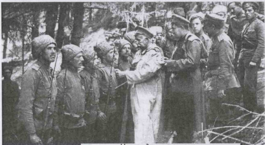
Награждение в окопах