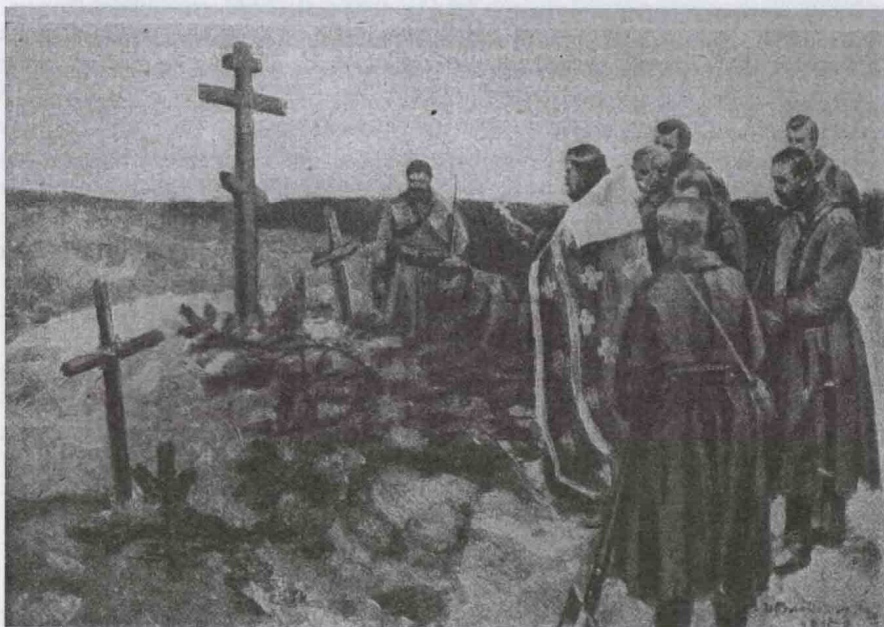
У братской могилы

Наш полк занял сопку под названием «Донской камень», правее была вершина, где располагалась смежная дивизия, а левее базировались туркестанские пластуны. Впереди был огромный провал – ущелье, за которым высилась гора Двухгорбая. Там едва различались окопы турок. В стереотрубы мы видели ежи и проволочные заграждения, насыпи, дым из землянок, маячили фигурки людей. С обратной стороны нашей сопки располагались 3 землянки и ходы сообщения, склады, баня. Сюда не долетали пули, а снаряды перелетали и рвались в ущелье. Здесь же, между соснами, хоронили убитых бойцов и ставили над могилами кресты.