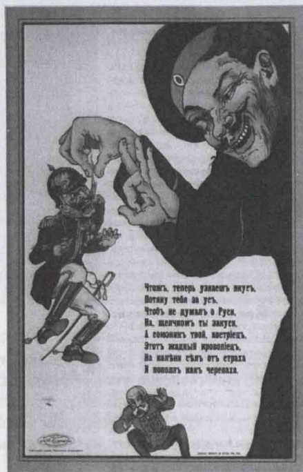
Плакат "Что ж, теперь узнаешь вкус..." 1914г.

Положение простого люда ухудшалось на глазах. Тогда и полетели в Орёл донесения, что «среди населения имеется неудовольствие по поводу бездеятельности властей по понижению цен, ... у населения беспокойство в связи с возрастающей дороговизной жизни...»