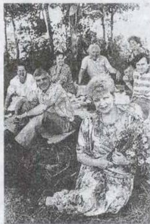
Коллектив редакции газеты «Знамя Ленина», 1994 г.