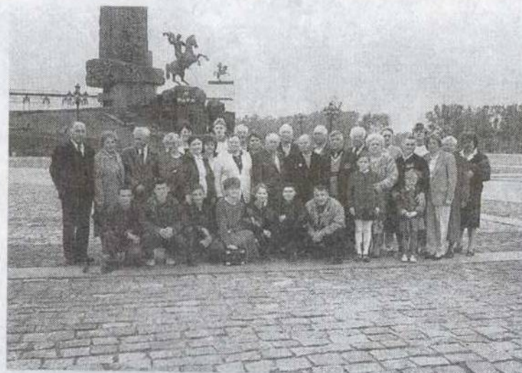
На поклонной горе, 1997