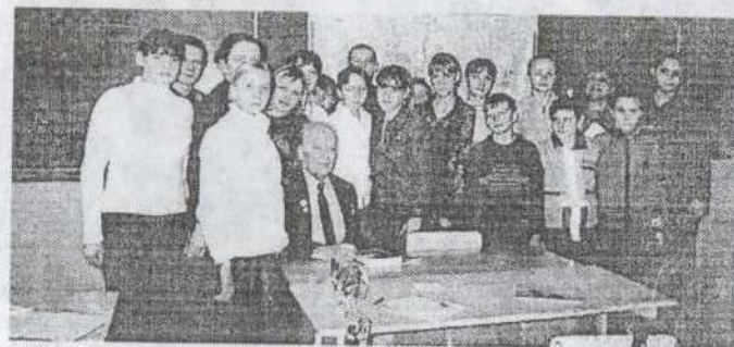
На уроке мужества