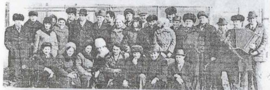
Журналисты ливенской районной газеты