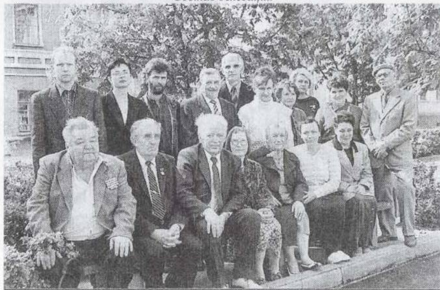
Коллектив редакции «Знамя Ленина»