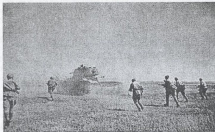
В атаку за танком